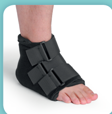
COMPREBOOT PLUS (voir page 56)